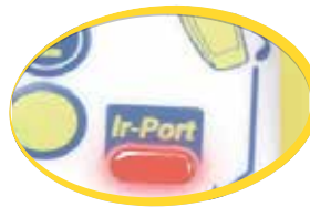
IRDA инфракрасный порт