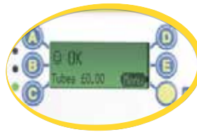
ЖК-дисплей с интуитивным меню